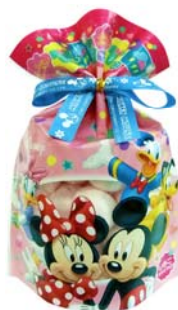
ミッキーマウス ファンシーマシュマロ

贈る側も贈られる側も一緒に幸せな気持ちになってほしいという思いを込め、世界中から愛され、大人から子どもまで親しまれているディズニーキャラクターをデザインしたギフトです。様々なシーンでのプレゼントにご利用いただける「ミッキーマウス・ファンシーマシュマロ」と「くまのプーさん・ファンシーマシュマロ」の2品を提案します。