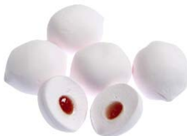
※商品中身(いちごマシュマロ)