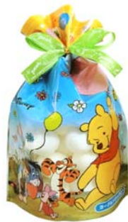
くまのプーさん ファンシーマシュマロ