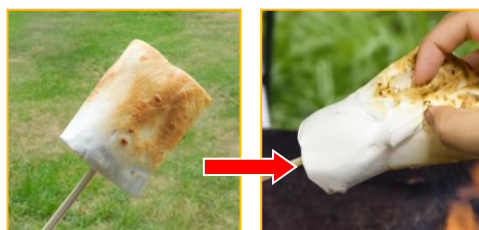
※焼いた表面をむいている様子